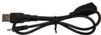
Y-kabel USB-A naar USB-C (EL0179)

Als de Modbus-kabel is klaar gemaakt, kan de Jullix geïnstalleerd en aangesloten worden.