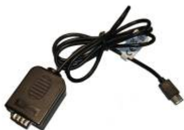
Kabel RS232 naar USB-C (EL0210)

Als de Modbus-kabel is klaar gemaakt, kan de Jullix geïnstalleerd en aangesloten worden.