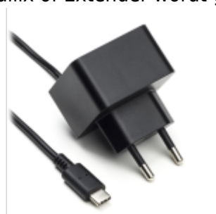
Voeding 5V USB-C

De Jullix of Extender wordt gevoed via een USB voeding.