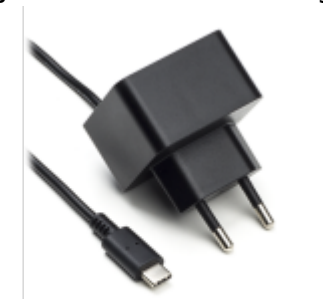
Voeding 5V USB-C

De Jullix of Extender wordt gevoed via een USB voeding.