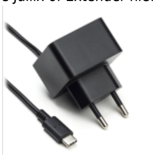
Voeding 5V USB-C

Als de Jullix of Extender niet via de P1 poort wordt gevoed dien je nog een USB voeding te gebruiken.