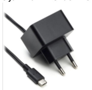
Voeding 5V USB-C

Als de Jullix of Extender niet via de P1 poort wordt gevoed dien je nog een USB voeding te gebruiken.