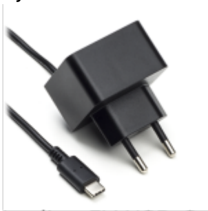
Voeding 5V USB-C

Als de Jullix of Extender niet via de P1 poort wordt gevoed dien je nog een USB voeding te gebruiken.