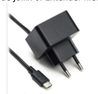
Voeding 5V USB-C

Als de Jullix of Extender niet via de P1 poort wordt gevoed dien je nog een USB voeding te gebruiken.