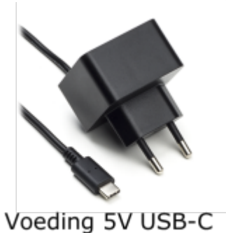
Voeding 5V USB-C

De Jullix of Extender wordt gevoed via een USB voeding.