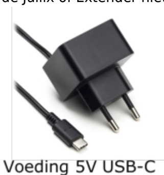
Voeding 5V USB-C

Als de Jullix of Extender niet via de P1 poort wordt gevoed dien je nog een USB voeding te gebruiken.