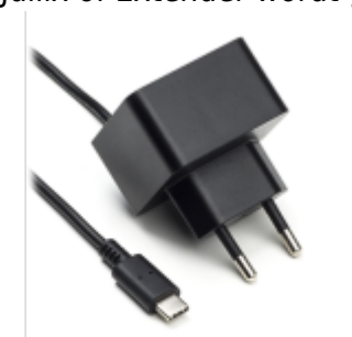
Voeding 5V USB-C

De Jullix of Extender wordt gevoed via een USB voeding.