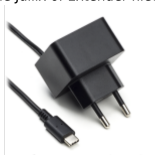
Voeding 5V USB-C

Als de Jullix of Extender niet via de P1 poort wordt gevoed dien je nog een USB voeding te gebruiken.