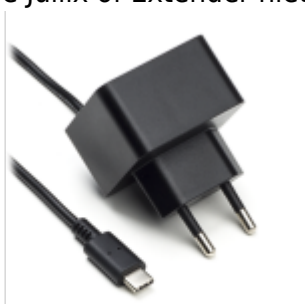
Voeding 5V USB-C

Als de Jullix of Extender niet via de P1 poort wordt gevoed dien je nog een USB voeding te gebruiken.