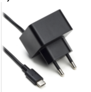
Voeding 5V USB-C

Als de Jullix of Extender niet via de P1 poort wordt gevoed dien je nog een USB voeding te gebruiken.